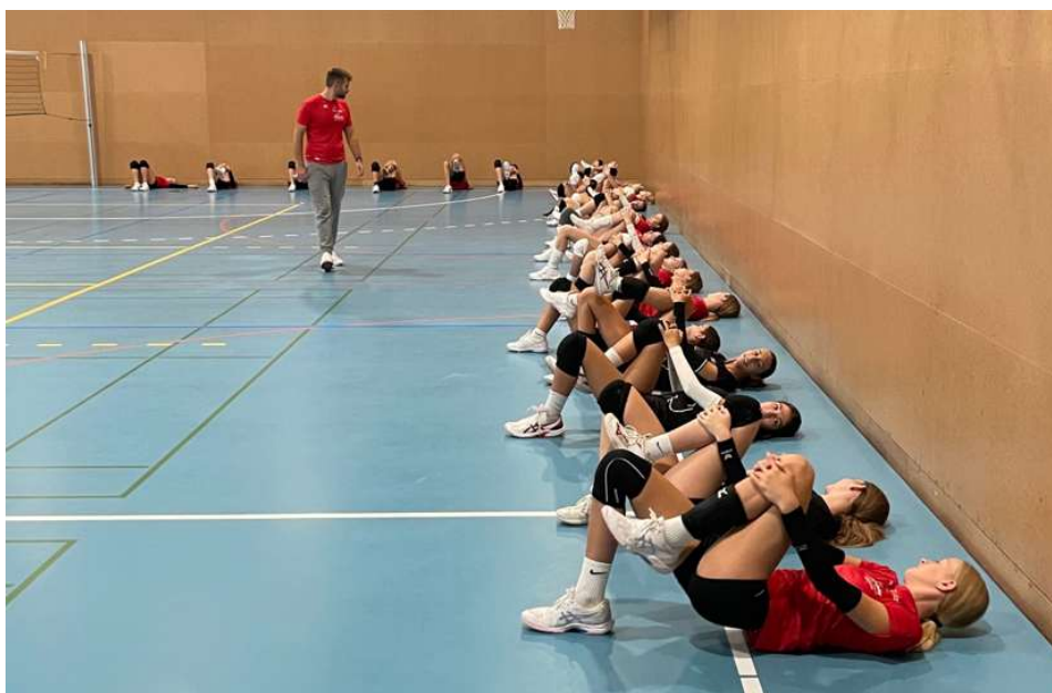
Einblick ins Dienstagtraining der Sportschülerinnen in der Spiel- und Turnhalle in Visp

Acht der SEK 2 - Sportschülerinnen an den Briger Schulen, nutzten unser Angebot von zwei Athletik-Trainings vom Montag und Donnerstag sowie einem Mittwochnachmittag Balltraining.