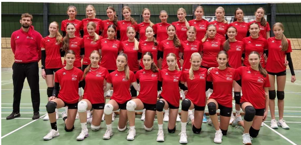
Sportschülerinnen der Volley Academy Valais anlässlich des Camps im November 2024